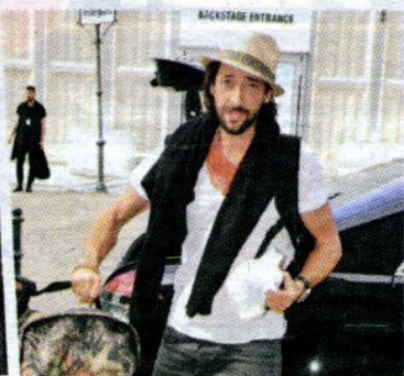
Adrien Brody am Mittwoch in Berlin, er kommt heute zu BOSS