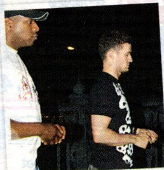
Justin Timberlake und Bodyguard vor dem „Grill Royal“