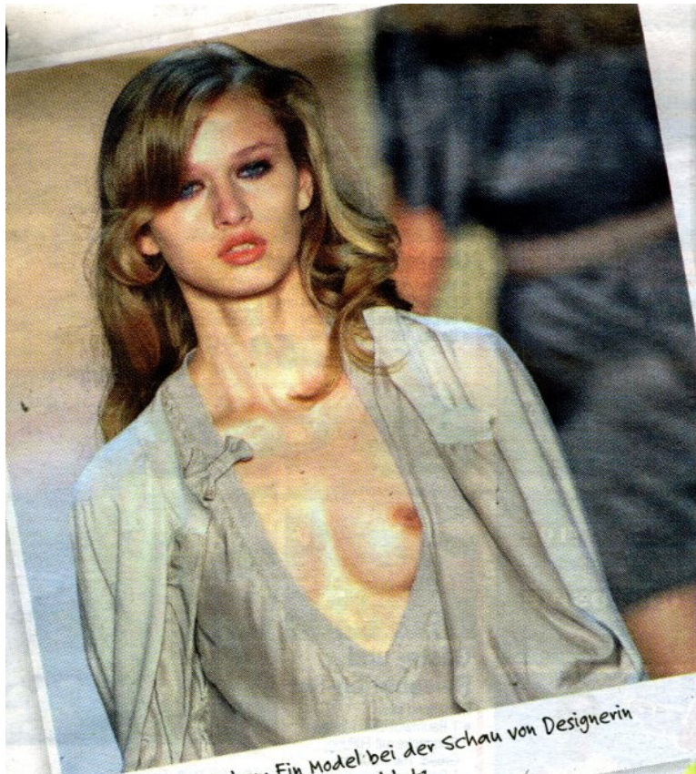
Mode mit Einblicken: Ein Model bei der Schau von Designerin Dorothee Schumacher am Bebelplatz